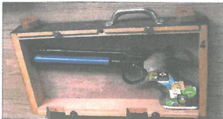
Prüfkasten 420mm x 200mm x 50mm

Zugelassen ist eine gerade Verlängerung der unterseitigen Griff-Auflagefläche von 40 Millimeter. Diese wird gemessen von der Fingerrille des kleinen Fingers (siehe Auszug Sportordnung). Zusätzlich muss die Luftpistole in den Prüfkasten passen. Abzugsgewicht und Gewicht der Waffe sind in der Sportordnung beschrieben.